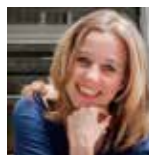
Elsbeth van Relax Mama